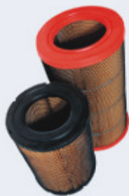
FILTROS DE AIRE SELLADO RADIAL