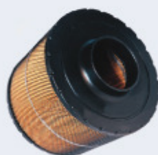
CARCAZAS FILTRANTES DE AIRE