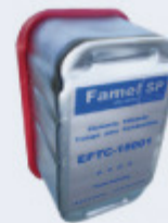
FILTROS DE COMBUSTIBLE