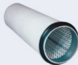
FILTROS DE PAÑO Separadores Aire Aceite