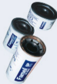
FILTROS DE ACEITE